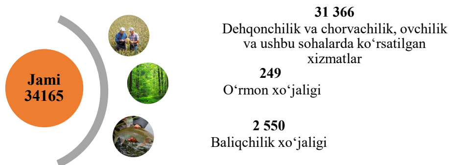
2-rasm. Qishloq, o'rmon va baliqchilik xo'jaligida faoliyat ko'rsatayotgan korxonona va tashkilotlar soni (fermer va dehqon xo'jaliklaridan tashqari, birlikda)

2024 yil yanvar-mart oyida qishloq, o'rmon va baliqchilik xo'jaligida yangi tashkil etilgan korxonona va tashkilotlar (fermer va dehqon xo'jaliklaridan tashqari) soni – 1 670 birlikni tashkil etdi.