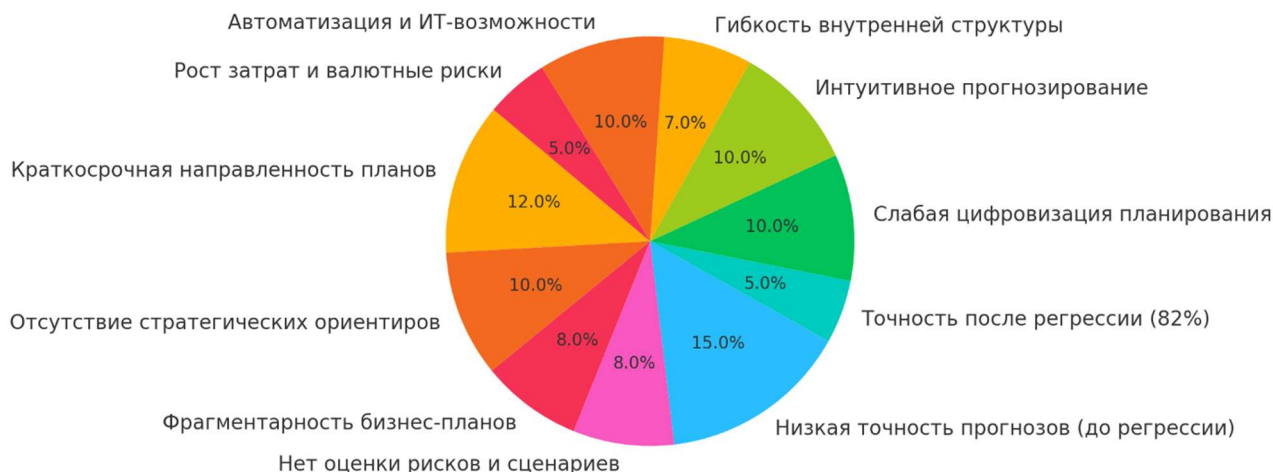
Рис. 1. Ключевые проблемы и возможности в бизнес-планировании ООО «BENGAL-TAMINOT»

несоответствием между фактическими результатами и прогнозными расчётами. Дальнейшее изучение методов прогнозирования, применяемых на предприятии, показало, что они базируются преимущественно на интуитивных суждениях управленческого персонала без опоры на экономико-математические модели или цифровую аналитику. Это приводит к низкой точности предсказаний, особенно в условиях рыночной неопределённости.