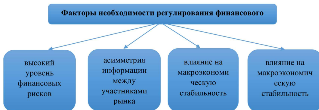
Рис.2 Причины регулирования финансового рынка

Финансовый рынок является одной из наиболее чувствительных сфер экономики, поскольку через него осуществляется перераспределение ресурсов, формирование инвестиций и управление рисками.