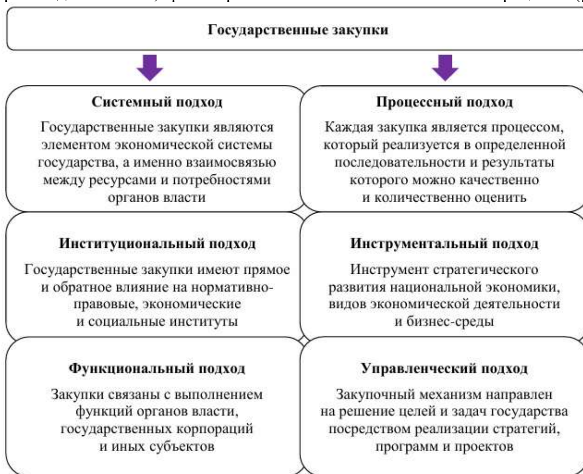
Рисунок 2 – Научно-теоретические концепции определения сущности государственных закупок

Осуществление государственной закупки регулируется законодательно, включает несколько взаимосвязанных стадий, которые реализуются субъектами в определенной цифровой технической среде, сопровождаются финансовыми, производственными, транспортно-логистическими и иными операциями (рис.2).